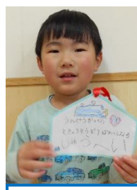
運動会の徒競走で 一番になる