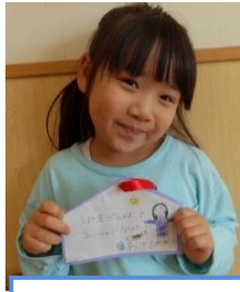
歌を頑張ってウィッシュ シュになりたい