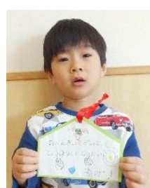
お勉強を頑張って 消防士になりたい