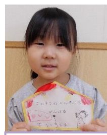
算数の勉強を頑張る