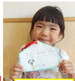
ママのお話を聞く