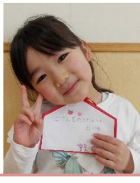
ご飯を残さないで食べる