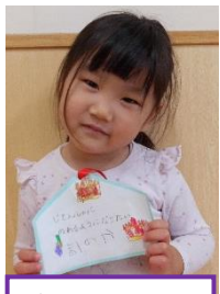
自転車に乗れる ようになりたい