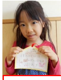
ママのお手伝いを 頑張る