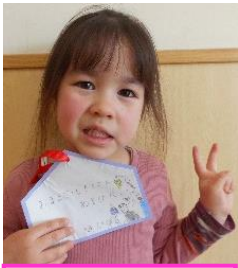
おままごとでたくさん 遊びたい