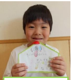
文字を読めるように 頑張る