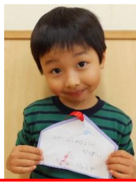
速く走れるように になりたい