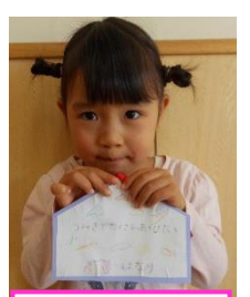
積み木でたくさん 遊びたい