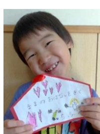
ママのお話を聞く