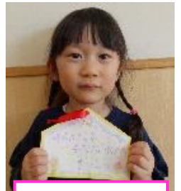
かわいい絵が描ける ようになりたい