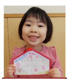
ママのお手伝いを いっぱいしたい