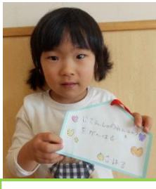
自転車の練習を頑張る